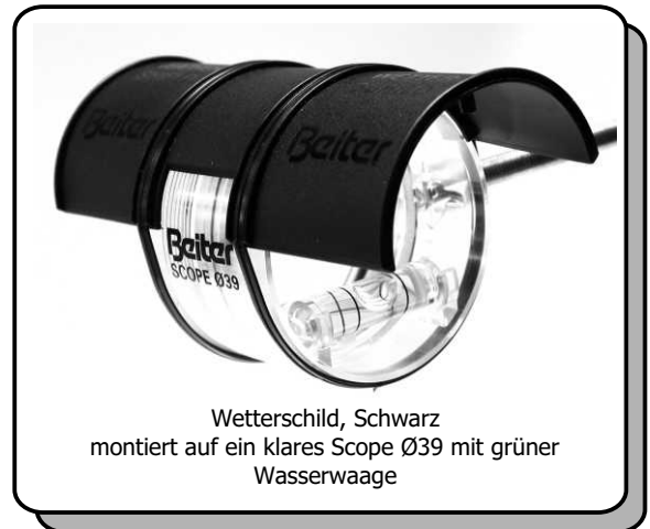
Wetterschild, Schwarz montiert auf ein klares Scope Ø39 mit grüner Wasserwaage

Die Probleme bei Regen und Sonne kennt jeder Schütze: Die Linse wird naß bzw. blendet.